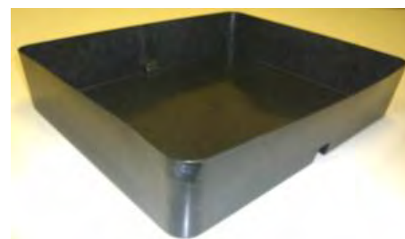
【MPM工法を使った成型品】