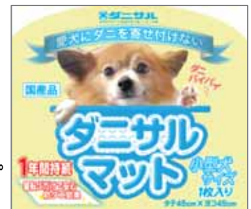
【ペット用不織布製品】