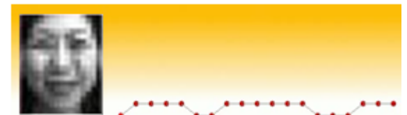
表情表出リズムの一例(笑い)