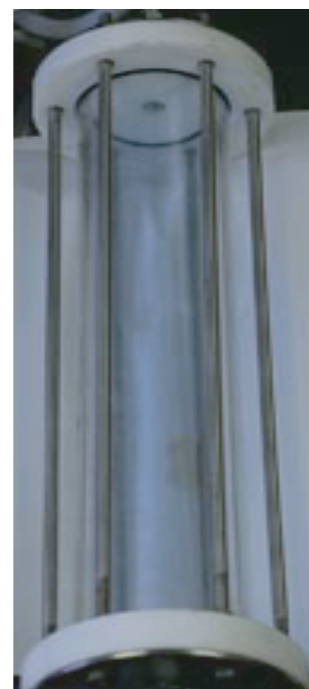
高濃度オゾン (うすい青色)