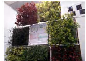
“カラフルeco5レンジャー”