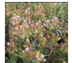
紅花シャリンバイ (ピンク)