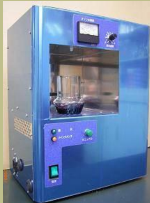
医療機関向け 手洗い兼用オン水生成装置