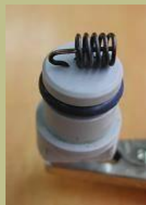
ガルバニー式オゾンセンサー