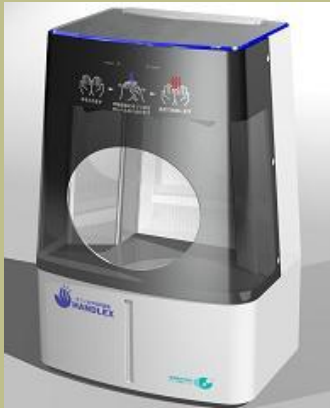
手洗い専用型 オゾン水手洗い器