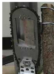
図3 枝噛み防止機構