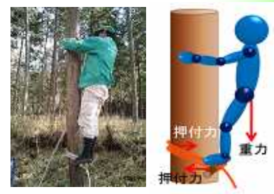
図1 昇降方式の原理

従来の自動枝打ち機は重量が重く急斜面での可搬性に乏しい。さらに、昇降速度が遅いのに加えて、枝噛みが生じたりして作業効率が悪いなどの理由により、多くの森林組合では十分に利用されず放置されている。これらの問題を解決し、高齢者でも可搬できる軽量で高速な枝打ちロボットを開発することを目的とする。