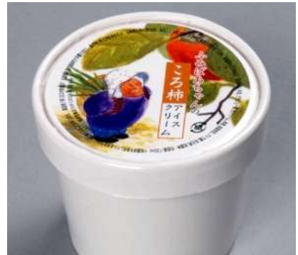
(株)なかむらにより試作販売中の「ころ柿のアイスクリーム」