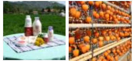
清里ミルクプラントの乳製品と、なかむらのころ柿

需要開拓方針として、従来の販路である、清里高原や峡東果実郷の観光客への販売に加え、本物志向で舌の肥えた富裕層を主な顧客として設定。