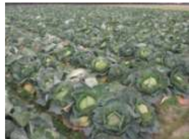
(有)くらた農産のキャベツ畑

(株)セイツーは、安心・安全な野菜を手軽で簡単にたくさん食べていただくため、過熱加工したスチーム・ベジタブルの製造・販売を計画。一方、商品開発には、品質が高く安心・安全な国産野菜が欠かせないが、従来から、「土づくり」の指導と取引を行っており、生産する野菜の品質の高さを認識していた(有)くらた農産と、連携を開始した。