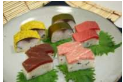
冷凍押し寿司イメージ

八戸前浜産さばを中心に、地元の鮭、鮪等特産品を原料とし、冷凍に適した低アミロース米「ゆきのはな」の適度なねばり、つや、冷めても軟らかくぼろぼろになりにくいといった特徴を活かした解凍により出来立ての食感を味わえる「冷凍押し寿司」の開発、製造、販売を行う。従来は寿司を扱い難かった飲食店等や機内食、船舶食などのニーズが高く、国内はもとより海外への市場も拡大していくものと期待される。