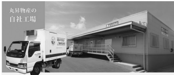
丸昇物産の 自社工場