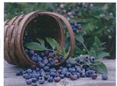
【中国貴州産ブルーベリー】