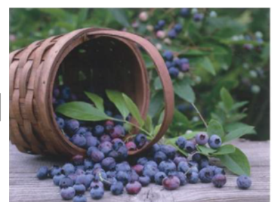
【試作したブルーベリーワイン】