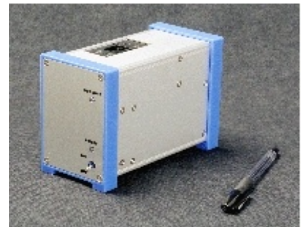
抗体チップの性能 検査装置