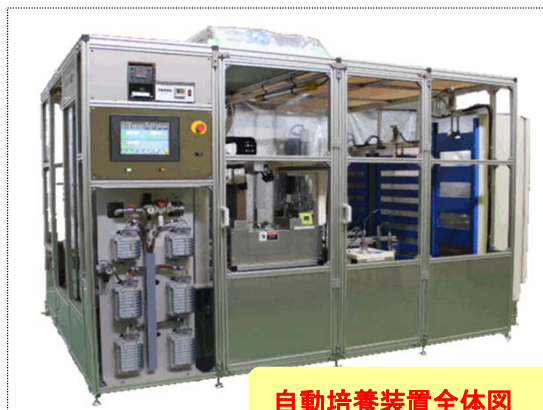
自動培養装置全体図