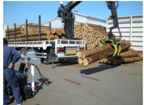
<ポータブル三次元画像解析材積測定器と測定風景>