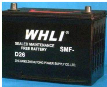
密閉型バッテリー