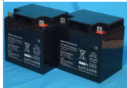
電動カート用バッテリー