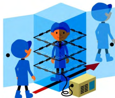
消毒設備イメージ