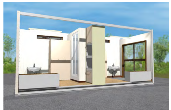
消毒設備付き更衣室イメージ