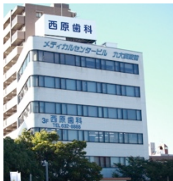
連携体各企業が入居する「メディカルセンタービル」