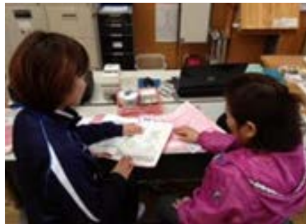
提供するサービスのイメージ