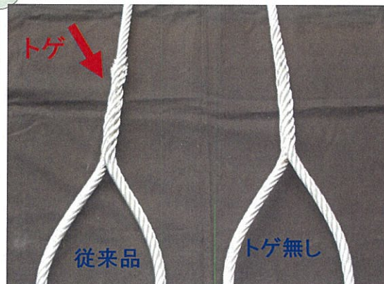
引っ張り試験破断面の比較