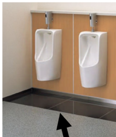
高殺菌・消臭「タイル」