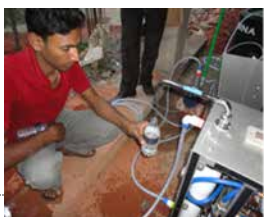
淡水化装置稼働状況