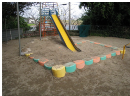
抗菌砂を投入した公園