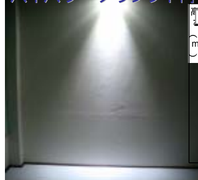
ハイパワーダウンライト(9W)の照度分布図