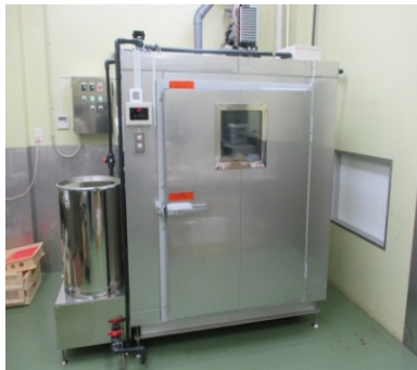
低温高湿度高機能解凍庫(試作機写真及び模式図)