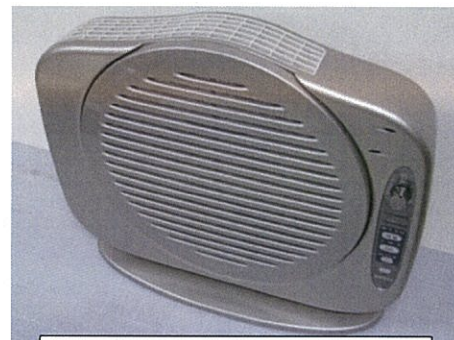
一体化ロータリーフィルターを活用した空気清浄機