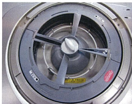
一体化ロータリーフィルター