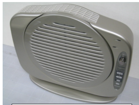
一体化ロータリーフィルターを活用した空気清浄機