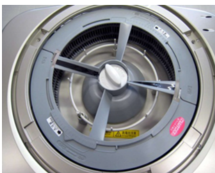
一体化ロータリーフィルター