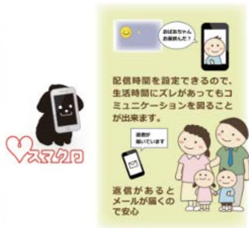
■「スマクロ」サービス概要