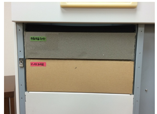
カートリッジ式フィルター部