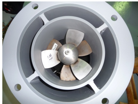
水力発電機 (上から)