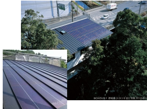
フレキシブルアモルファスシリコン太陽電池