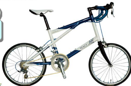
最新ハイスペックミニベロ