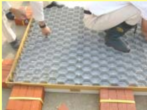
八ニカムブロック設置図