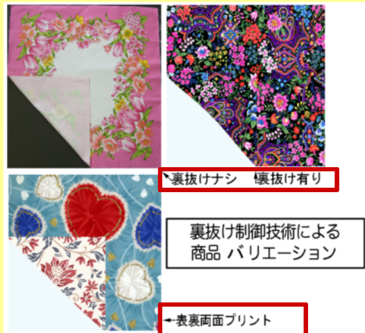
裏抜けナシ 裏抜け有り