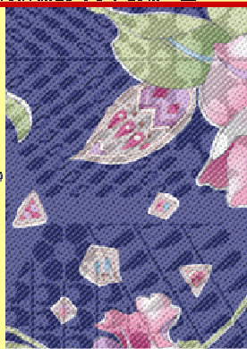
織物紋様とプリント模様の重ね合わせ