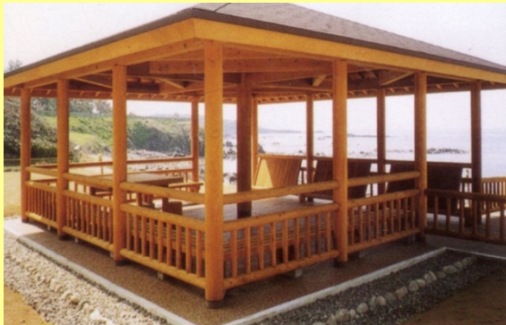
福井県内の公園の東屋