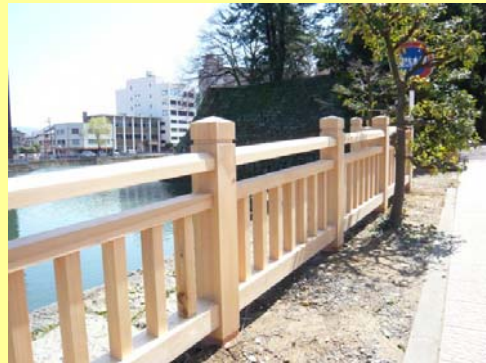
福井城址のお堀にかかる橋の欄干