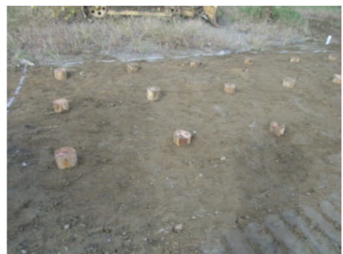
完了後の地盤表面