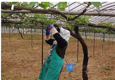
ブドウの施設栽培