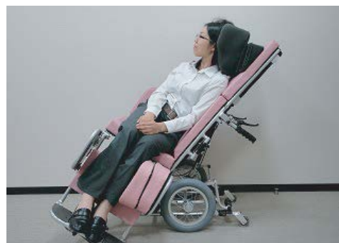
使用時姿勢のイメージ