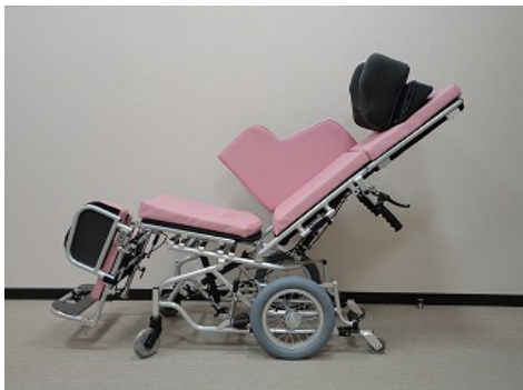
摂食・嚥下補助用車いす