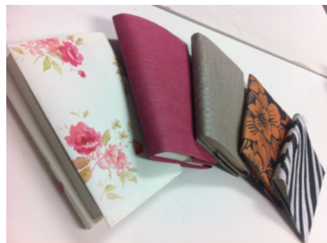
【クロスブックカバー】