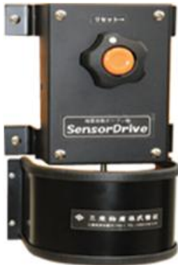
内蔵する感震駆動器