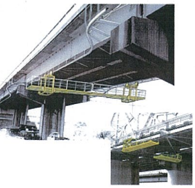
橋脚メンテナンスのイメージ図