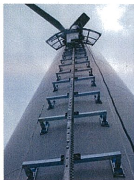
風力発電タワーのメンテナンス