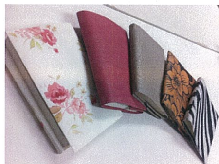
【クロスブックカバー】