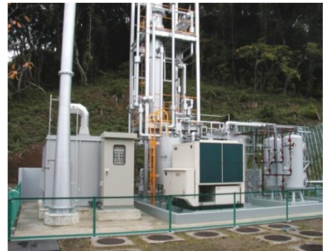
アンモニア排水処理装置全体