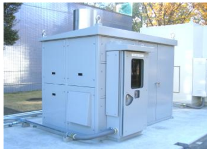
アンモニアガス処理装置