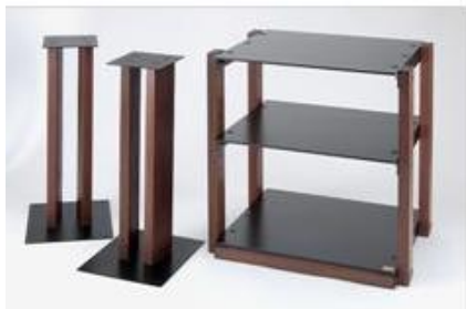
スピーカースタンド