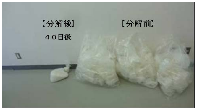
【分解前・分解後の比較】