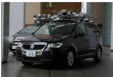
【モバイルマッピングシステム】