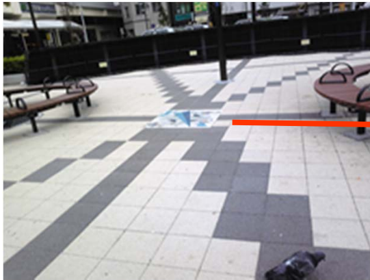
路面標示板設置例