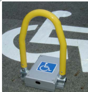
置き型の車止めゲート本体