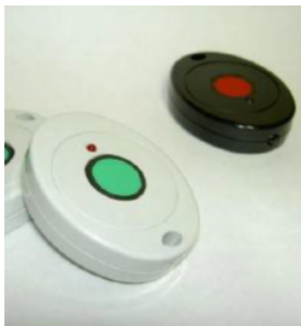
コントロール用リモコン