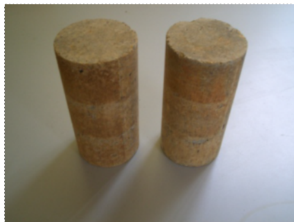
藻類増殖ブロックサンプル